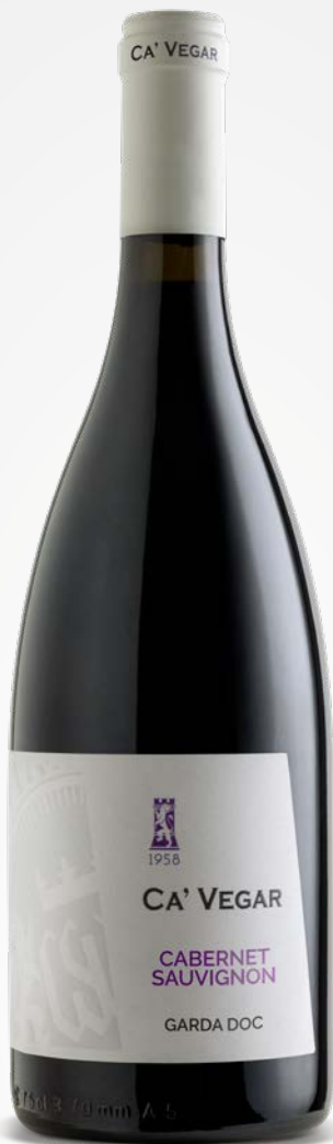
Ca' Vegar CABERNET SAUVIGNON GARDA DOC